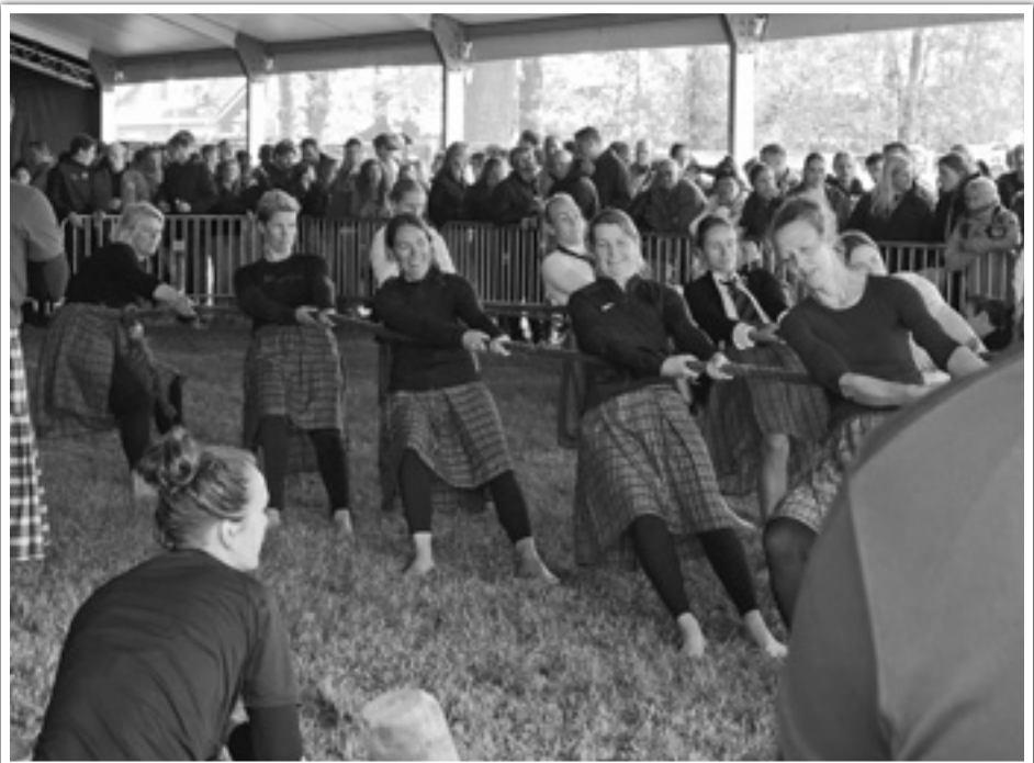
Sterke dames in actie tijdens de Highland Games in Koekange.