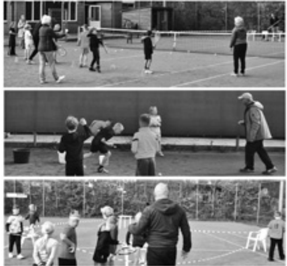
Sportdag bij TV de Marke - groep 3 t/m 8 in actie op de gravelbaan

Het was een geslaagde ochtend. Leuk om te zien hoe enthousiast de kinderen meededen! Aan het eind van de ochtend kreeg iedereen een tennisdiploma mee, met daarop een overzicht van de activiteiten die deze zomer nog op het programma staan: