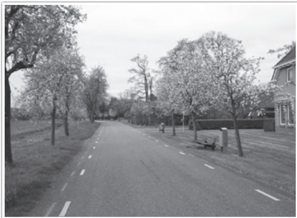
Perenpracht langs de Larijweg in Ruinerwold