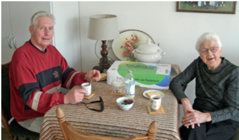
Maandag 6 maart 2023: op de koffie met cake in Ruinerwold.