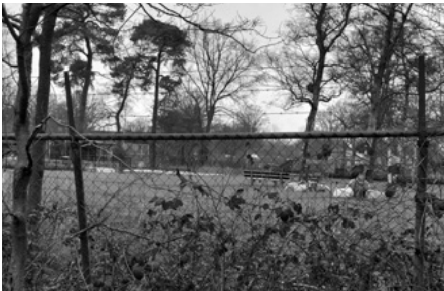
Schape op de weide bij het zwembad in Havelte.