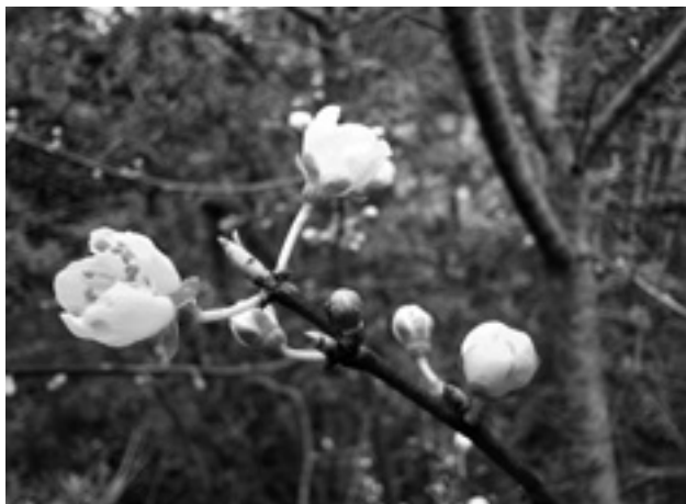
Voorjaarsbloemen in Darp.