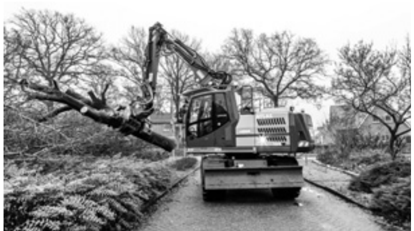
Bomenkap rondom de Veldkei.